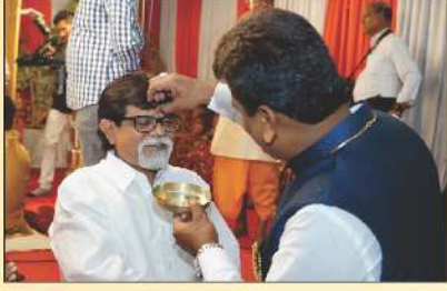
નવા પાંચવર્ષીય રજત દાતાશ્રીને તિલક કરતા