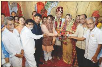
મહાજનશ્રી દ્વારા કન્યાદાન કરતા