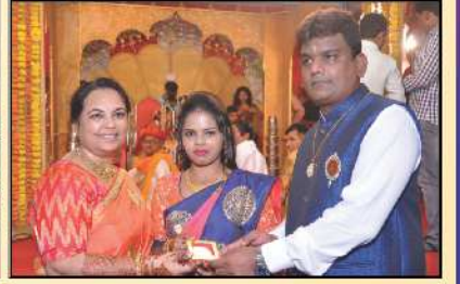
મહેઠ્ઠી લગ્નાડનારનું અહુમાન