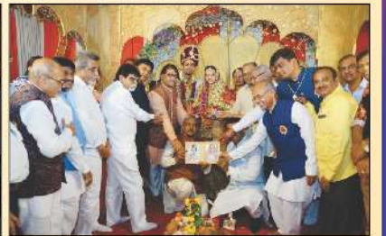
મહાજનશ્રી દ્વારા નવયુગલને ફોટોફ્રેમ આપતા