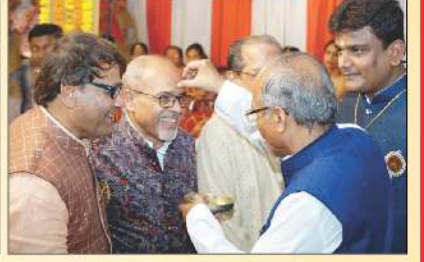
નવા પાંચવર્ષીય કાંસ્ય દાતાશ્રીને તિલક કરતા