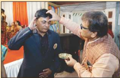
દાતાશ્રીને તિલક કરતા પ્રમુખશ્રી