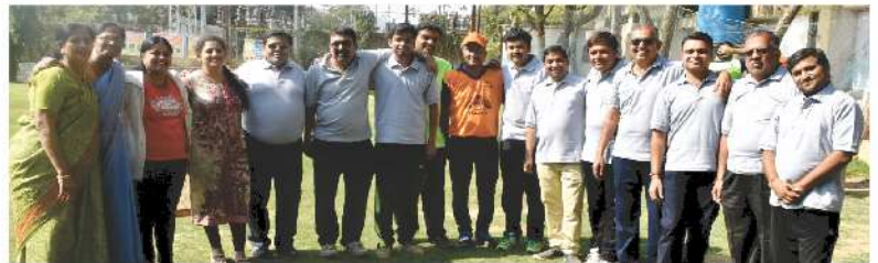
KDO Committee & Project Working Committee