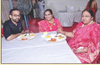
ભોજન વાપરતા દાતાશ્રી પરિવાર