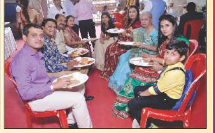
મનભાવન ભોજન વાપરતા જ્ઞાતિજન