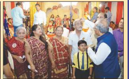
દાતાશ્રીને તિલક કરતા