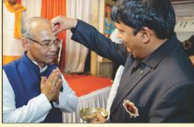
નવા પાંચવર્ષીય કાંસ્ય દાતાશ્રીને તિલક કરતા