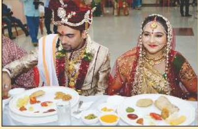
મનભાવન ભોજન વાપરતા વર અને વધુ