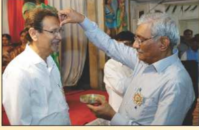
નવા પાંચવર્ષીય કાંસ્ય દાતાશ્રીને તિલક કરતા