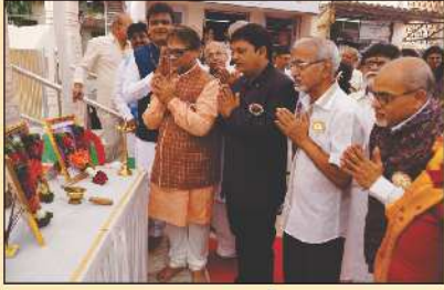
દાતાશ્રી પરિવાર અને પ્રમુખશ્રી દિપ પ્રગટન કરતા