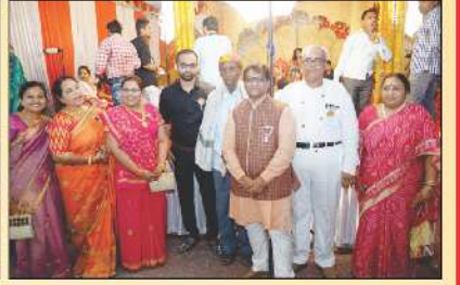
નવા પાંચવર્ષીય સુવર્ણ દાતાશ્રી પરિવાર