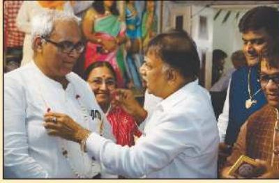
નવા પાંચવર્ષીય સુવર્ણ દાતાશ્રીનું અહુમાન