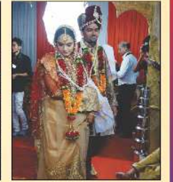
નવયુગલ ફેરા લેતા