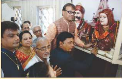
શેકશ્રી નરશી નાથા અને માતુશ્રી કુંવરબાઈને હાર પહેરાવતા