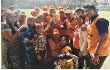
Winning Team Jihan Tigers