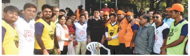
Chief guest : Shri Lalitbhai Kolhe (Mayor Jalgaon)